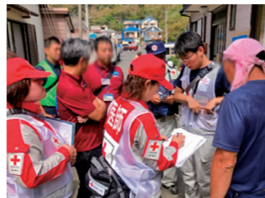
【台風15号】住民へ被災状況や生活状況の聞き取りを行いました