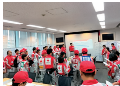
【台風15号】日赤千葉県支部でのミーティングの様子

今後も、防災訓練や研修に積極的に取り組み、災害発生時には迅速な対応がとれるよう、日頃から関係機関と連携し、準備を進めてまいります。