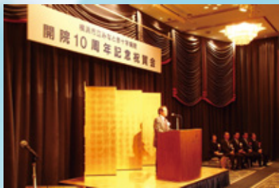
式辞を述べる四宮院長

当院は今年、開院10周年を迎えました。4月24日(金)にはホテルニューグランドにおいて「開院10周年記念講演・祝賀会」を開催し、300人を超える皆さまにご出席いただき、盛会となりました。